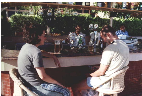
Biertest am Strand in Hurghada